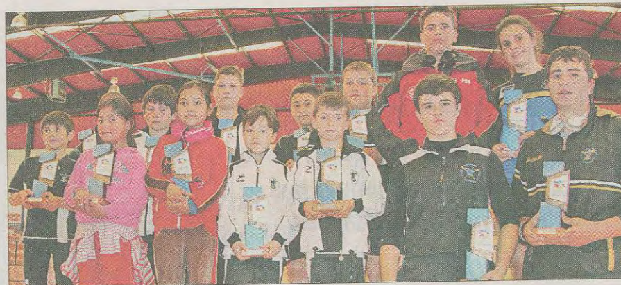
Los remeros más jóvenes del club posan con varios trofeos.

La entidad deportiva veigueña acepta el galardón con «orgullo y responsabilidad»